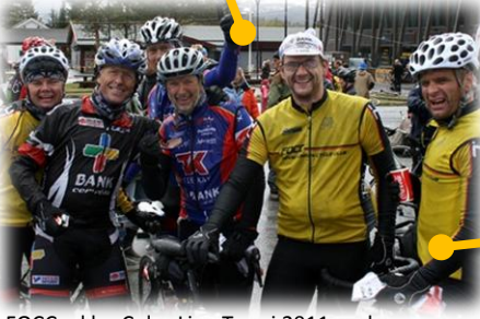
FOCC sykler Color Line Tour i 2011, og her er en gjeng som nettopp har kommet i mål under 6 timer