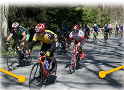
FOCCs første deltakelse i et turritt var Bukkene Bruse 2007. Rykk inn til 6.plass i Tur1