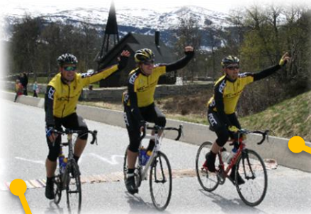
FOCC sykler Color Line Tour i 2007 på 7 timer!