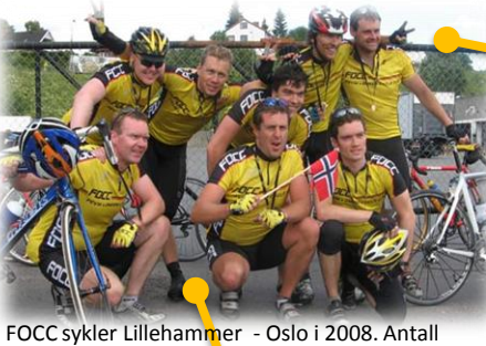
FOCC sykler Lillehammer - Oslo i 2008. Antall medlemmer hadde økt fra 7 til 17stk på den tiden.