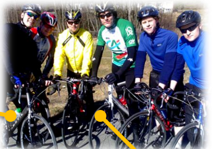
En av Fevikklubbens første treningsøkter! 7 sykende medlemmer var det i starten