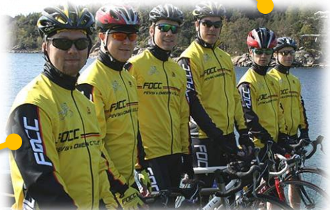
Første photo shoot med nye gule & svarte drakter!