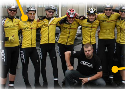
FOCC deltar i Den store styrkeprøven fra Trondheim til Oslo i 2007.