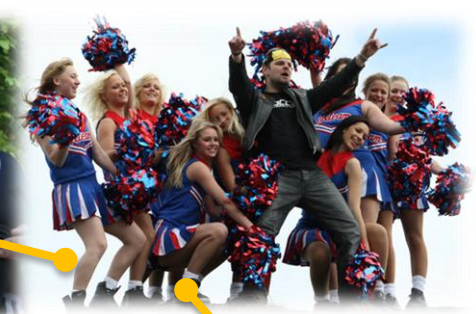
FOCC spiller inn musikkvideo; My legs are OK