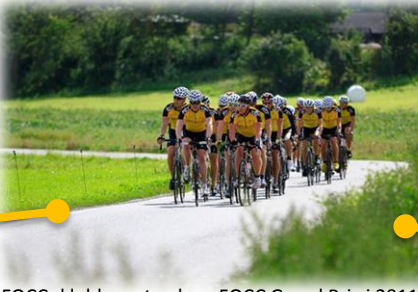
FOCCs klubbmesterskap FOCC Grand Prix i 2011. Snart 40 medlemmer på dette tidspunktet.