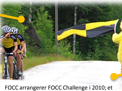
FOCC arrangerer FOCC Challenge i 2010; et uformelt treningsritt i sommerferien.