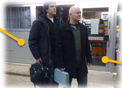
23. desember 2006; FOCC ble stiftet en kveld vi opprinnelig skulle spille poker hos Ivæ.