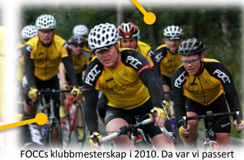
FOCCs klubbmesterskap i 2010. Da var vi passert 30 medlemmer.