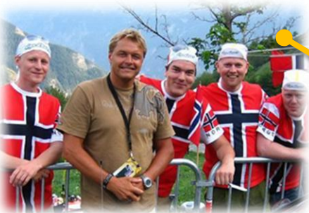
Fire barndomskamerater dro på road trip til Frankrike for å se Tour de France.